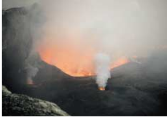
Kuva 3. Laavajärvi Nyiragongon kraatterin pohjalla. Etualalla ylempään tasanteen reunaa.

(1957); kirschsteiniitti (1957); trikalsiliitti (1957); delbayeliitti (1959) sekä andremeyeriitti (1973). Th.G. Sahama kirjoitti yksin tai assistenttiansa kanssa Nyiragongosta ja sen laavoista petrologisia ja mineralogisia kuvauksia sekä kaksikin laajaa monografiaa ja kohosi maailmanmaineeseen geokemian lisäksi näin myös vulkanologina ja mineralogina.