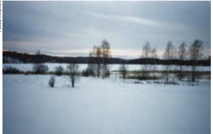
Espoonlahden NATURA 2000-alue maaliskuussa 2002.