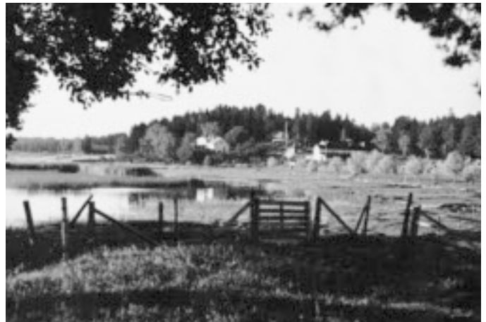
Sama ranta-alue eri suunnasta 1930-luvulla. Taustalla näkyy Bastvikin kartano rakennuksineen.

Uposkuoriaisten toukkia löytyi lähes koko alueelta. Molemmista murtovesilajeistamme tavattiin aikuisia yksilöitä ja M. pubipennis -lajia nimenomaan perinteiseltä esiintymisalueeltaan. Kanta näytti siis edelleen voivan hyvin ja NATURA -alueen raja-olevan kohdallaan. Viime kesänä inventoitiin lisäksi Espoonlahden Kirkkonummen puoleista ranta-alueita noin kilometrin matkalta kaakkoon lahden yli johtavan sillan kupeesta merelle päin. Aikuisia yksilöitä löydettiin tässä inventoinnissa molemmista lajeista rehevästä Sarfviken-lahden poukamasta. Espoonlahdesta tunnetaan siis tällä hetkellä kaksi M. pubipennis -esiintymää, jotka sijaitsevat toisistaan noin kilometrin etäisyydellä. Koska esiintymät sijaitsevat lahden vastakkaisilla rannoilla ja välissä on melko syvä vettä, voidaan ne luokitella omiksi erillisiksi esiintymiksi.