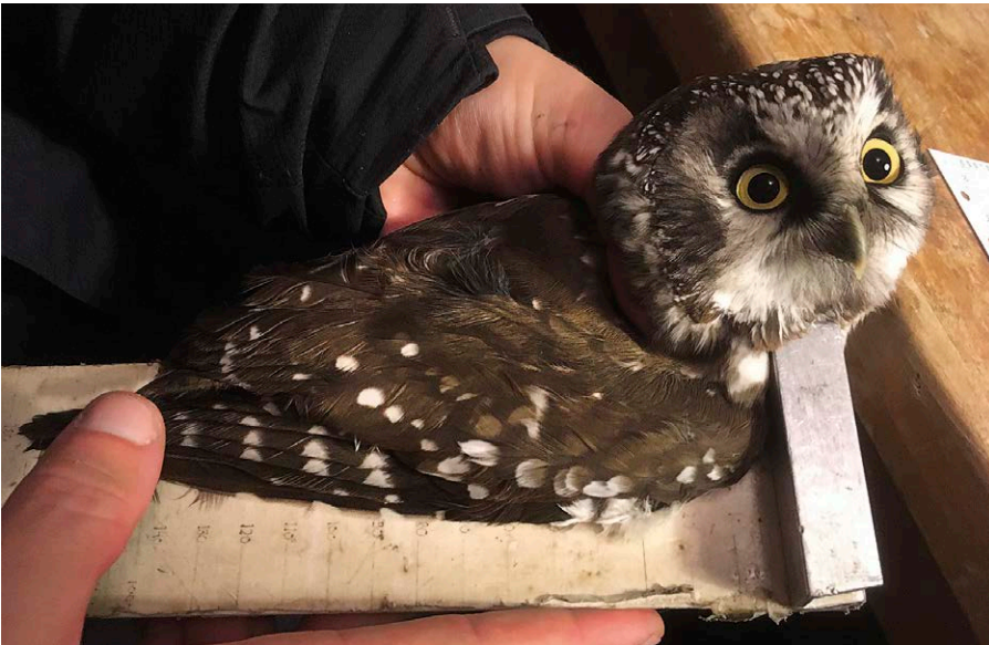
Helmipöllön siiven mittaus minimimenetelmällä. Tengmalm's Owl's Aegolius funereus wing being measured by the minimum chord length method. ALEKSI LEHIKONEN