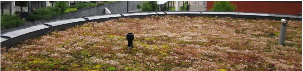
Pariisinkatu, Helsinki 2011

Tarkastelimme viherkattojen toteutumisen reunaehdoja monitoimijaisissa rakennushankkeissa kahden tapausesimerkin valossa ja havaitsimme, että kasvillisuuden käyttö osana rakennuksia haastaa vakiintuneet rakentamisan käytännöt ja roolit. Viherkattojen kaltaisten ratkaisujen onnistunut toteuttaminen edellyttää monialaista ja integroivaa suunnitteluosaamista rakentamisen prosessissa.