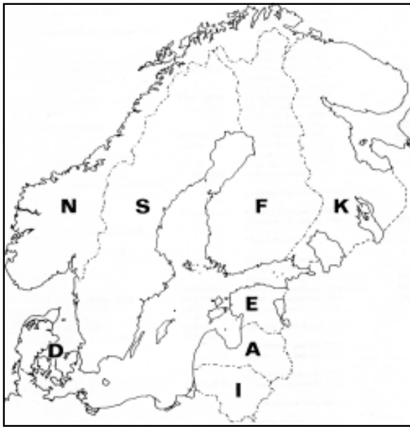
Kuva 1. Luettelossa käytetyt maakohtaiset lyhenteet. Bild 1. De landsvisa förkortningarna som används i katalogen. Figure 1. Abbreviations of the countries as used in the catalogue.

The previous list was arranged systematically using the system gradually created by R. Crowson in numerous works. A number of changes were introduced by Lawrence & Newton (1995), and this revised system has already been used widely. It is generally accepted here, too. In some cases the intrafamilial classification is based on still more recent works, so for instance in Adephaga the new Palaearctic catalogue (Löbl & Smetana 2003), in Staphylinidae the catalogue of Herman (2001), in Erotylidae the revision by Węgrzynowicz (2002) and in Curculionidae to a large extent the catalogue of Alonso-Zarazaga & Lyal (1999).