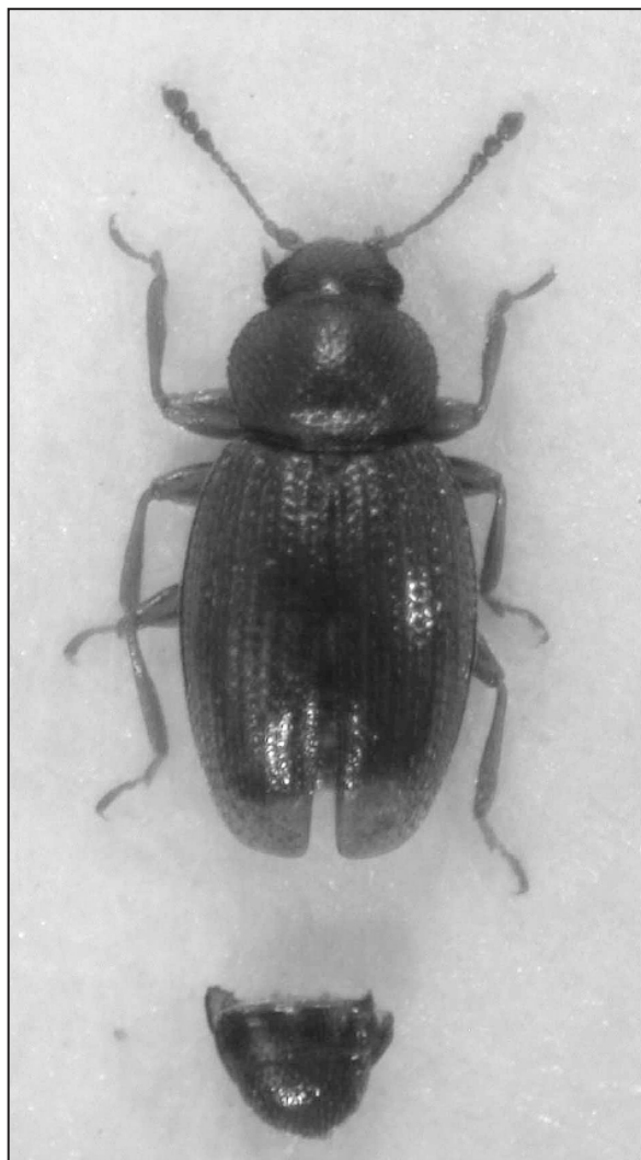
Kuva 3. Corticarina truncatella . Ka: Virolahti, Leervikinniemi, 14.6.2003.

Virolahden kovakuoriaisseminaarin yhtenä retkikohteena oli Leervikinniemi, jossa kovakuoriaisia kerättiin mm. seulomalla rannalle aiemmin ajautunutta levävallia. Seuloksista löytyi yhteensä 3 yksilöä puolinyhäkäslajia Corticarina truncatella . Kovakuoriaisten tarkistustyöryhmä on tarkistanut yhden koirasyksilön määrityksen. Useiden yksilöiden löytyminen samalla kertaa viittaa siihen, että