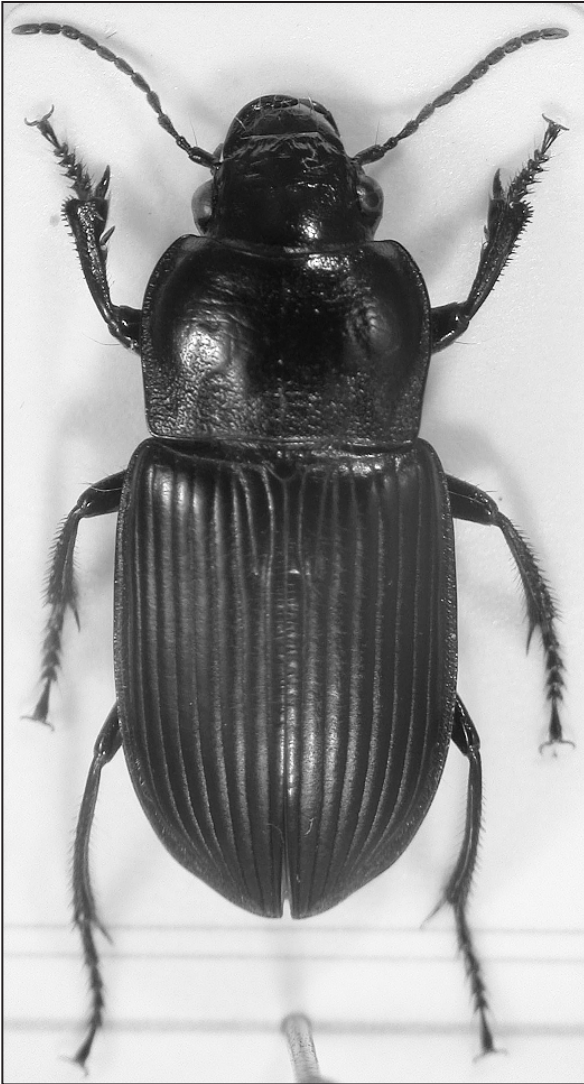
Kuva 1. Anisodactylus signatus . Sa: Juva, Koikkala, 20.9.2003.